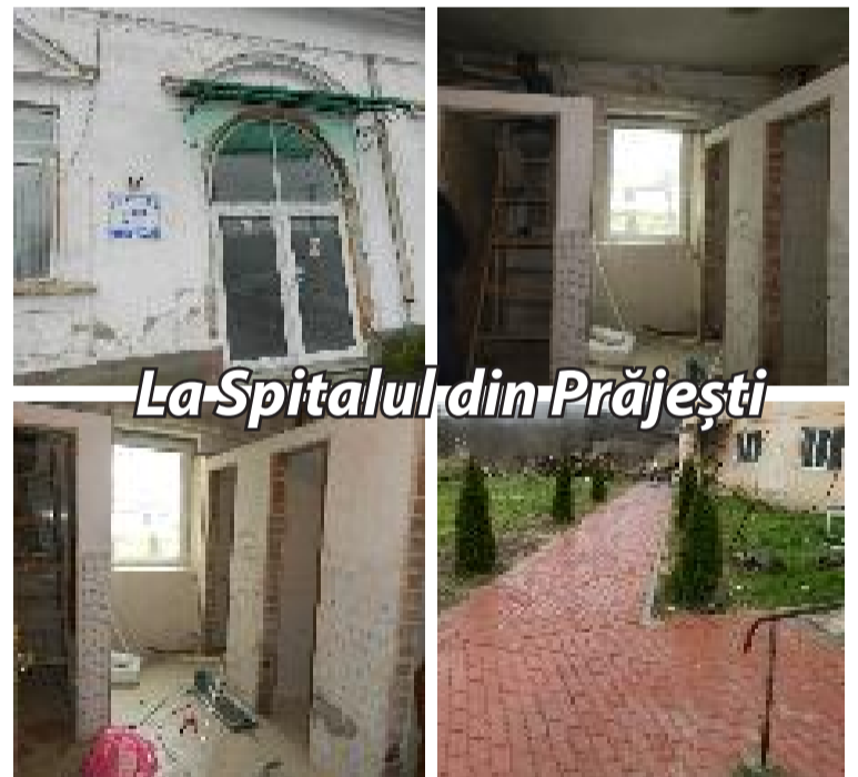
La Spitalul din Prăjești

Am fost și noi să vedem cum decurg lucrările și am constatat că nu se face rabat de la calitate și toate lucrările aflate în derulare în momentul de față se desfășoară într-un ritm susținut, intenția fiind finalizarea lor cât mai rapidă. Imaginile vorbesc de la sine!