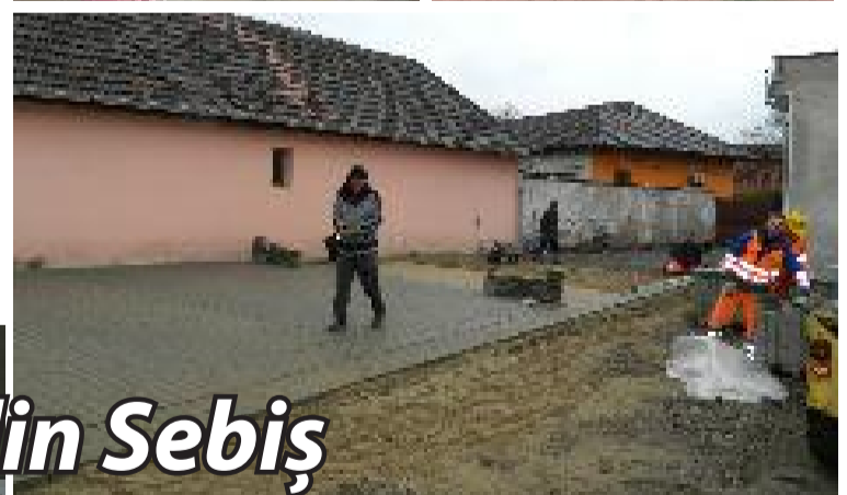
La Spitalul Orașenesc din Sebiș