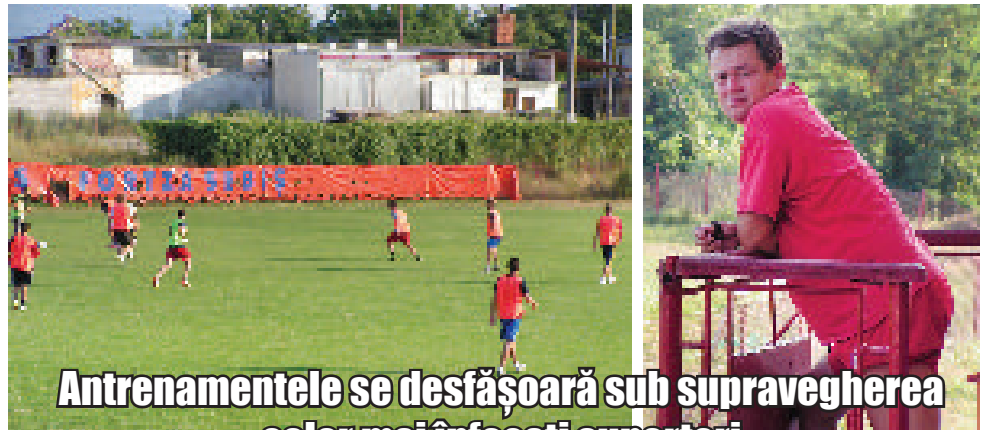
Antrenamentele se desfășoară sub supravegherea celor mai înfocați suporteri