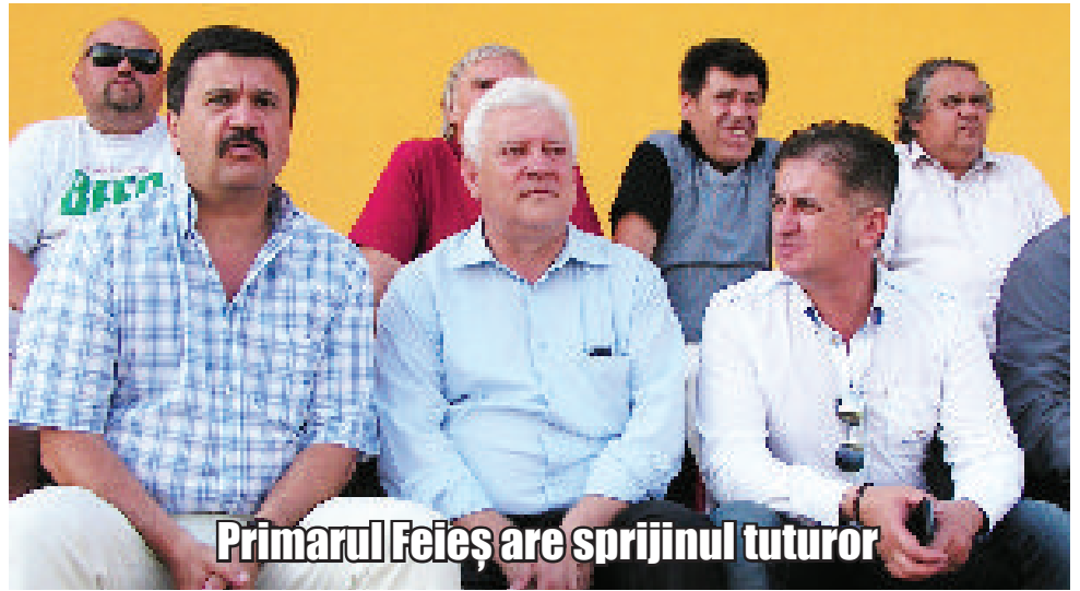
Primarul Feieș are sprijinul tuturor

Pentru a putea sprijini și mai mult echipa, primarul Feieș i-a adus la antrenamente și pe deputatul Eusebiu Pistru și pe președintele Consiliului Județean Arad Nicolae Ioțcu. Ambii din urmă și-au declarat sprijinul față de primarul nostru, promițând să sprijine Național Sebiș. Ba mai mult, primarul nostru a obținut și promisiunea de a fi sprijinit în construirea unui centru de juniori puternic care să devină pepinieră de jucători pentru echipa mare.