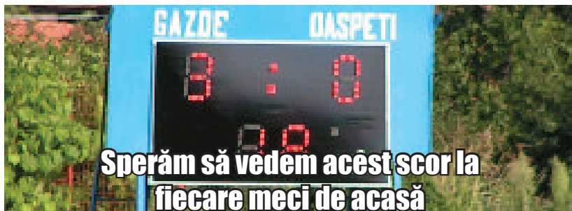
Sperăm să vedem acest scor la fiecare meci de acasă

După finalizarea hotelului de la baza sportivă, unde se asigură cazare tuturor fotbaliștilor, s-au inițiat noi investiții necesare pentru modernizarea centrului sportiv al orașului. Astfel, s-a achiziționat și deja s-a și amplasat o tabelă electroni-