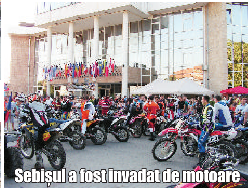
Sebișul a fost invadat de motoare