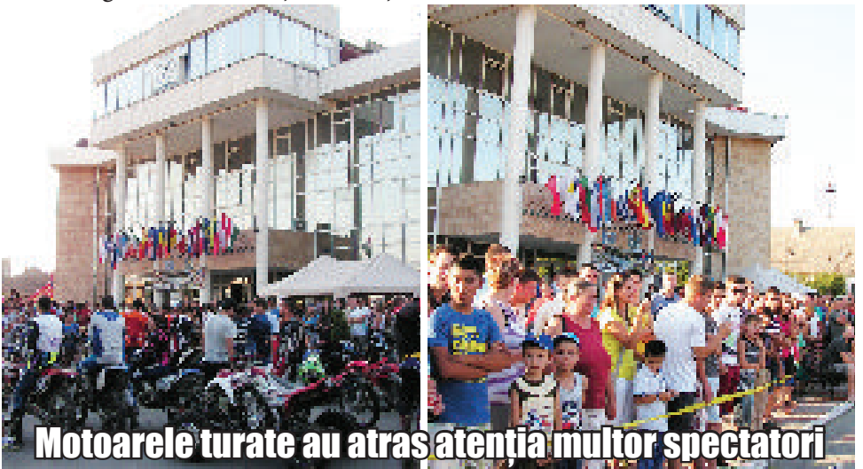
Motoarele turate au atras atenția multor spectatori