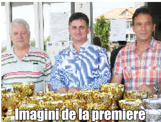
Imagini de la premiere