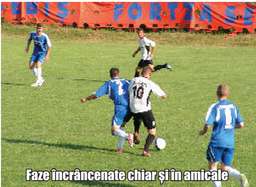
Faze încrâncenate chiar și în amicale

Toată suflarea din oraș așteaptă cu nerăbdare începerea campionatului! Nu de alta dar fotbalul se mănâncă pe pâine la Sebiș, iar gândul că Ineul sau Pâncota ne-ar putea încurca produce frisoane tuturor iubitorilor de fotbal din oraș. Apropierea noului sezon fotbalistic încinge spiritele peste tot, toată lumea debătând la maxim soluțiile posibile pentru ca Național Sebiș să iasă învingătoare din toate înfruntările. Febra sportului rege se regăsește peste tot, la mesele de pe terasa hotelului și nu numai, discuțiile ajungând într-un final la același subiect: Național Sebiș.