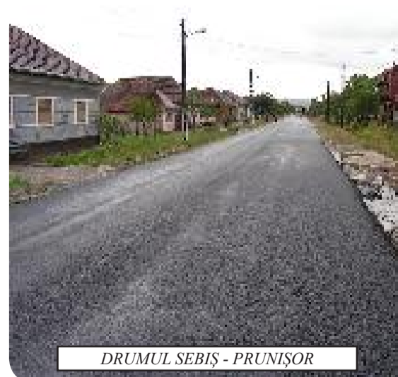
DRUMUL SEBIȘ - PRUNIȘOR