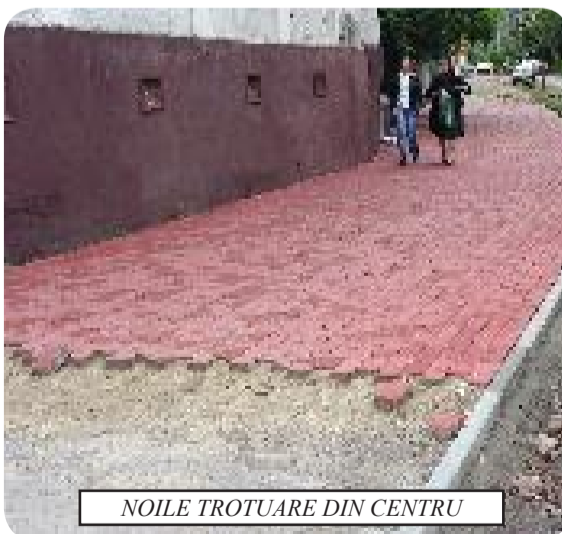
NOILE TROTUARE DIN CENTRU