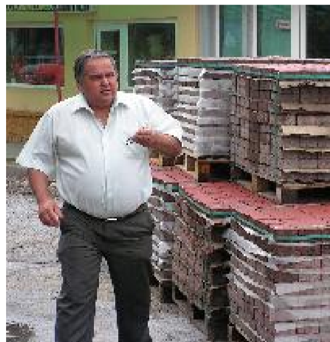
VICEPRIMARUL RADU DEMETRESCU, ÎN INSPECȚIE LA LUCRĂRILE DE AMENAJARE A TROTUARELOR.