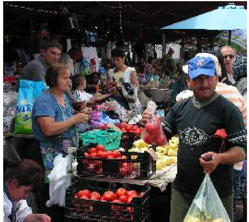
LA PIAȚĂ ÎN SEBIȘ