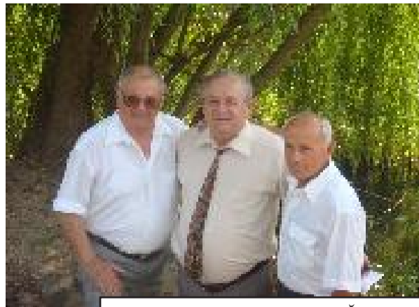
IMAGINI DE LA LANSARE CĂRȚII „SEBIȘ 50 DE ANI DE FOTBAL 1922- 1972”