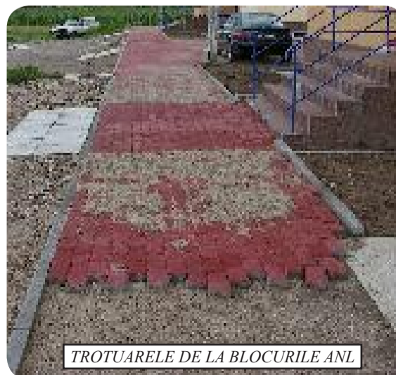
TROTUARELE DE LA BLOCURILE ANL