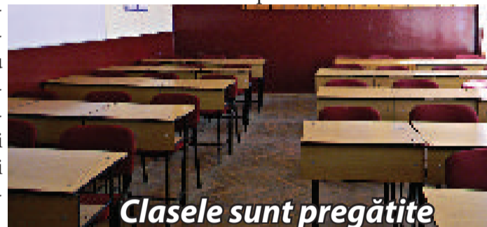
Clasele sunt pregătite

În orașul nostru, școlile au fost deja pregătite pentru a-i primi pe elevi, fiind igienizate și salubritate corespunzător. Școala poate începe!