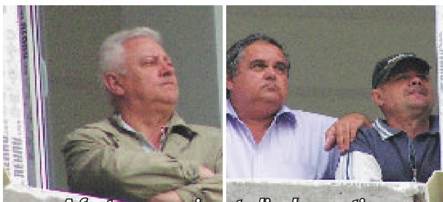
A fost un campionat plin de emoție