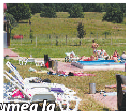
Toată lumea la ȘTRAND