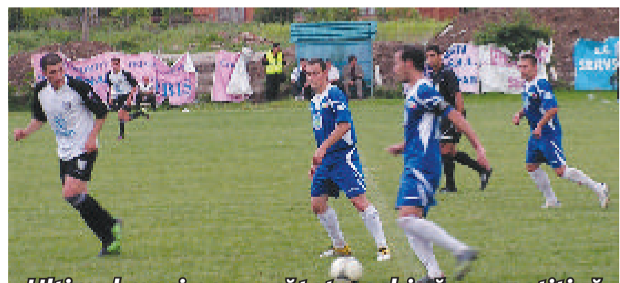
Ultimul meci ne-a arătat o echipă competitivă